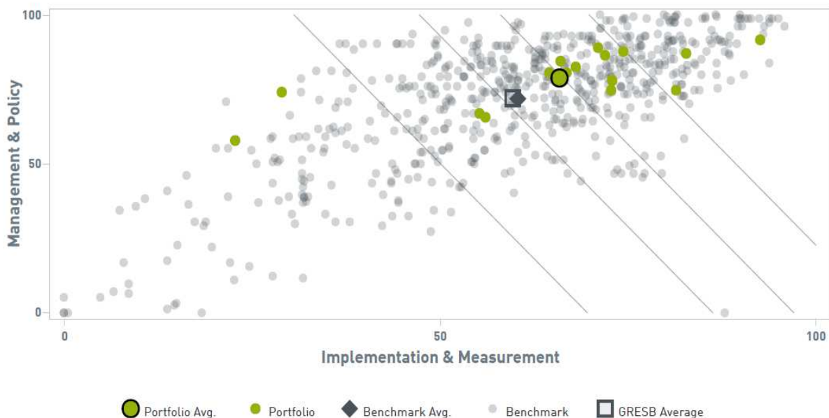
Figuur 1: Duurzaamheidsscore vastgoedportefeuille PNO Media in vergelijking tot de peer groep

Op basis van de GRESB-resultaten blijkt de duurzaamheidsscore van de vastgoedportefeuille van PNO Media in 2016 wederom te zijn verbeterd met een totaalscore van 70 punten (2015: 62 punten). Hiermee scoort de vastgoedportefeuille van PNO Media beter dan de GRESB benchmark score van 64 punten (2015: 59 punten).